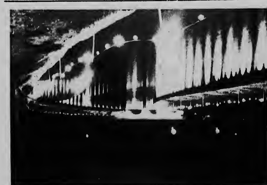
Zo ziet de Lagoen in Oranjestad eruit, wanneer 's avonds om half zeven de gekleurde lampjes ontstoken worden en deze met jonge palmen omzomende Lagoen herschepen in een sprookjestuin.